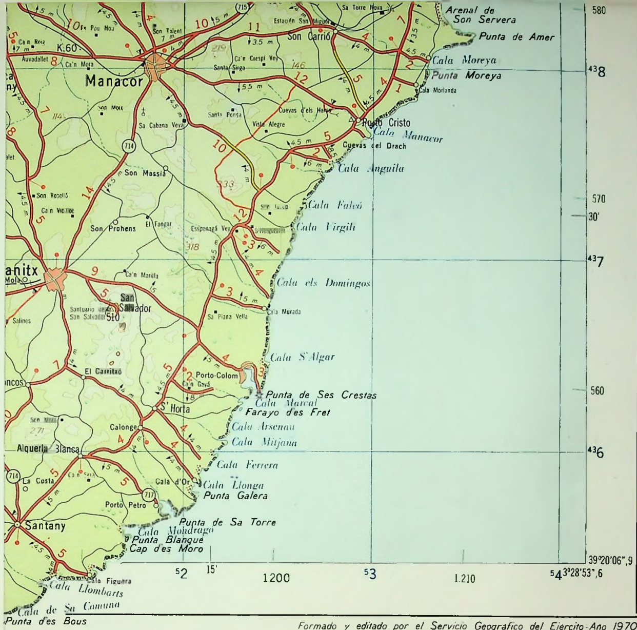
Formado y editado por el Servicio Geográfico del Ejército - Año 1970